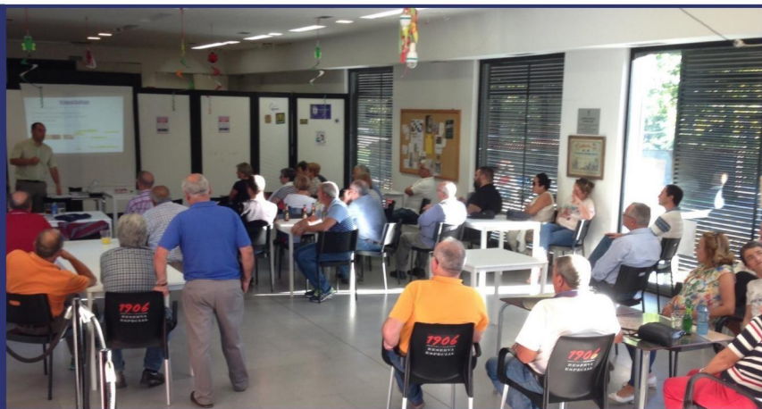
Entre Outubro e Decembro celebramos Asembleas Abertas coa veciñanza

Durante os meses de Outubro, Novembro e Decembro de 2017 levamos a cabo por todas as parroquias do concello Asembleas Abertas coa veciñanza para discutir temas de gran relevancia para o futuro de Culleredo como a participación veciñal nos orzamentos ou o desenvolvemento do novo Plan Xeral de Ordenación Municipal.