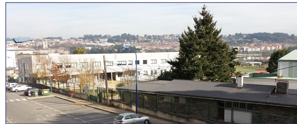
O Concello terá que pagar 1,5 millóns de euros por parte dos terreos do CEIP Ría do Burgo

Tampouco sabemos por que non era abondo con esta parcela e por que houbo que sumarlle terreo adicional para a edificación do colexio. Tampouco está aclarado porque o edificio do colexio cambia a orientación desde o proxecto básico ao definitivo, pasando de paralelo á rúa María Cagiao a perpendicular a esta rúa, feito que acaba provocando a ocupación da parcela motivo do litixio.